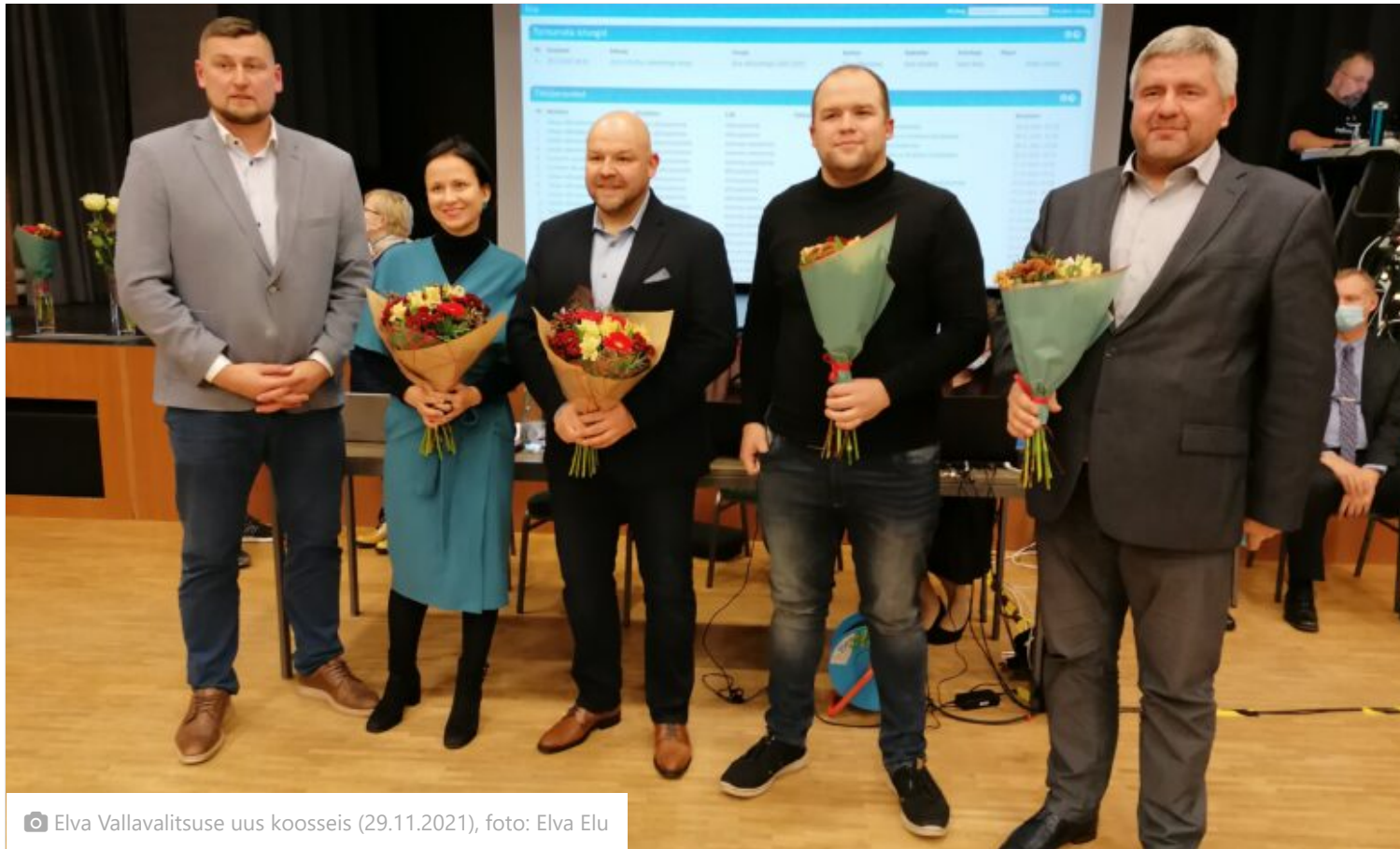
📷 Elva Vallavalitsuse uus koosseis (29.11.2021)